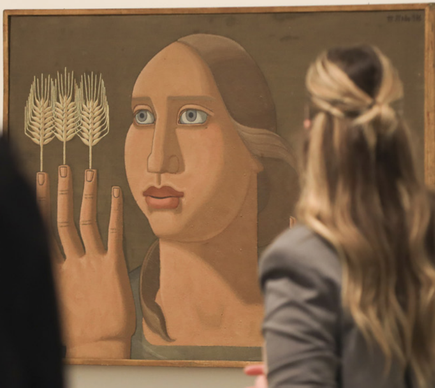
Vista de la exposición Maruja Mallo: Máscara y compás