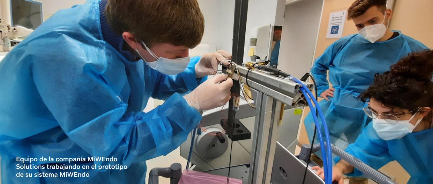
Equipo de la compañía MiWendo Solutions trabajando en el prototipo de su sistema MiWendo

“Como asesor de Mind the Gap , considero que este programa ha sido clave en el ecosistema español. España genera ciencia excelente en el sector de la salud, pero su reto histórico ha sido la transferencia. En un ecosistema aún emergente, Mind the Gap ha actuado como catalizador y como puente cultural, trasladando al ámbito académico la importancia de transformar innovación en impacto real”.