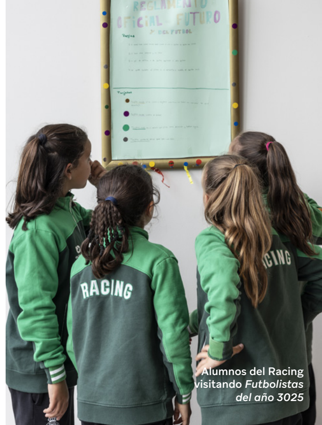
Alumnos del Racing visitando Futbolistas del año 3025

"Mas que un lugar, el Centro Botín es un momento en el que me detengo y contemplo. Me hace mucho bien y siempre salgo mejor de lo que entré".