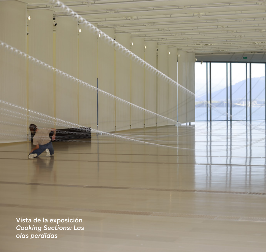
Vista de la exposición Cooking Sections: Las olas perdidas