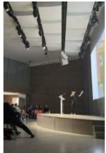
Charlas Tipos en el Centro Botín

Otras aportaciones fueron para el Ateneo de Santander, una colaboración que ya es de largo recorrido y que se destina al desarrollo de actividades culturales, la Fundación Empieza por Educar y la Asociación Plaza Porticada. La Fundación Renzo Piano y el Festival Internacional de Piano de Santander también recibieron el apoyo de la Fundación Botín en 2022, contribuyendo así al desarrollo de sus actividades.