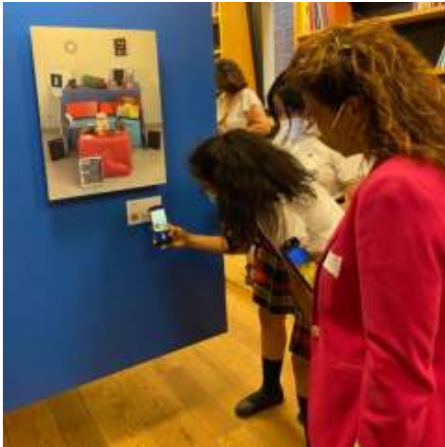
Inauguración de la exposición Somos Creativos XVI en la sede de Madrid