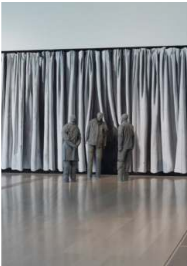
Vista de la exposición "Juan Muñoz. Dibujos. 1982-2000"