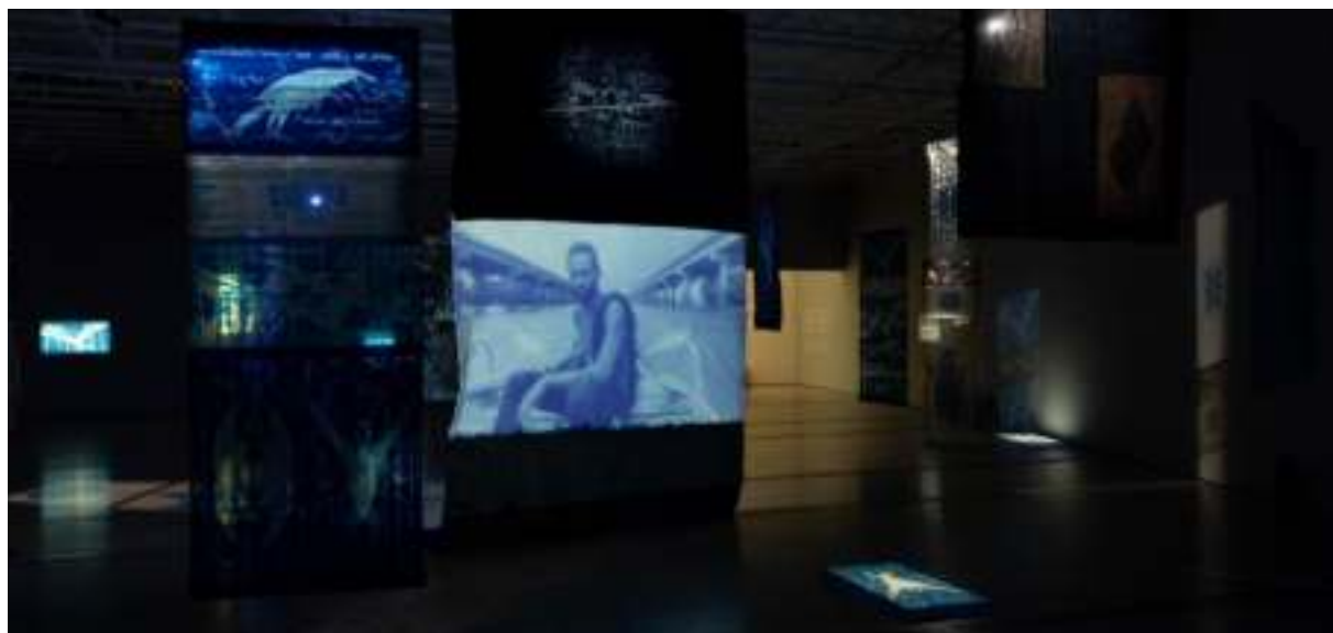
Vista de la exposición "Ellen Gallagher with Edgar Cleijne: a law, a blueprint, a scale"

DIVA, Concierto del 5º aniversario. 25/06/2022