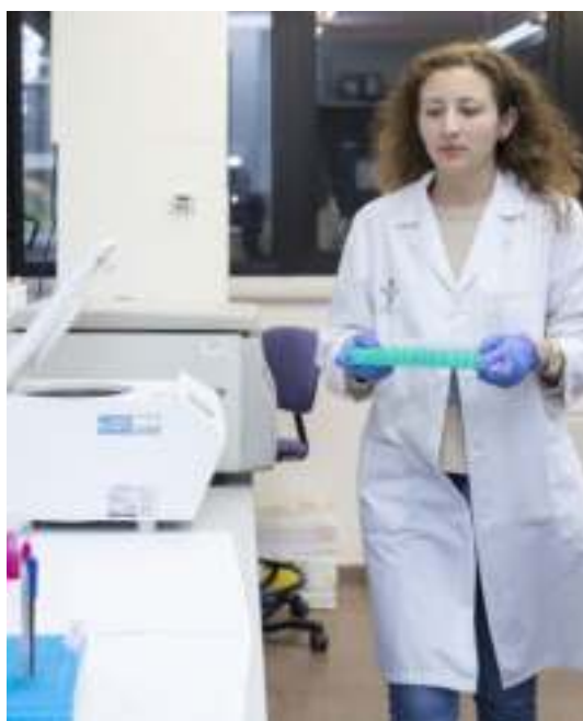
Equipamiento del laboratorio de la empresa MiWendo Solutions