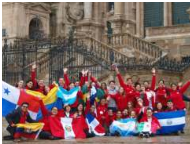
Tras tres días en Camino, los participantes de la XIII edición del programa llegaron a la Plaza del Obradoiro en Santiago de Compostela