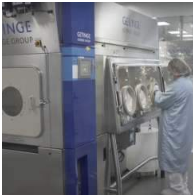
Liofilizador de viales de la empresa Vaxdyn