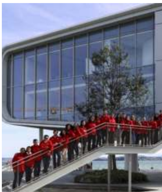
La formación de la XIII edición del programa continuó en el Centro Botín, en Santander, donde visitaron la exposición "Damián Ortega: Visión expandida"