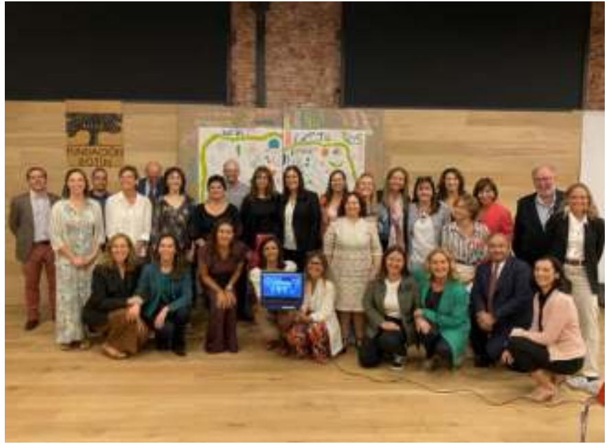
Clausura de la 2ª edición del Programa Especialista en Educación Emocional Social y de la Creatividad para la Transformación Educativa

Gutiérrez Rojas, una actividad que reunió a más de 1.800 profesores de diferentes países interesados en el tema. En paralelo, dentro de los Conecta ER , que son encuentros entre centros educativos con una tipología específica, ha tenido lugar entre centros de educación especial “Tender puentes entre la educación especial y la educación inclusiva”, por un lado, y entre centros rurales “Recorrido de 360º por los perfiles de los centros rurales” por otro, con la participación de comunidades como Galicia, Murcia, Aragón, Castilla y León, Cantabria y Madrid.