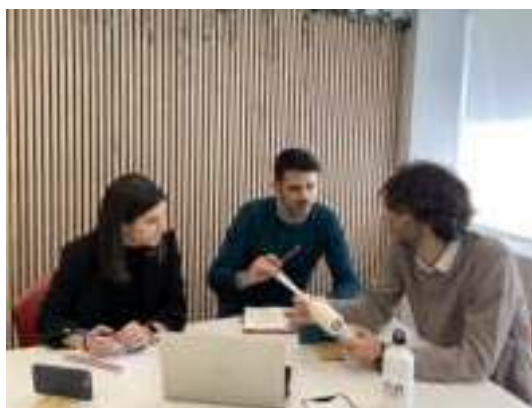
Equipo de la empresa Innitius