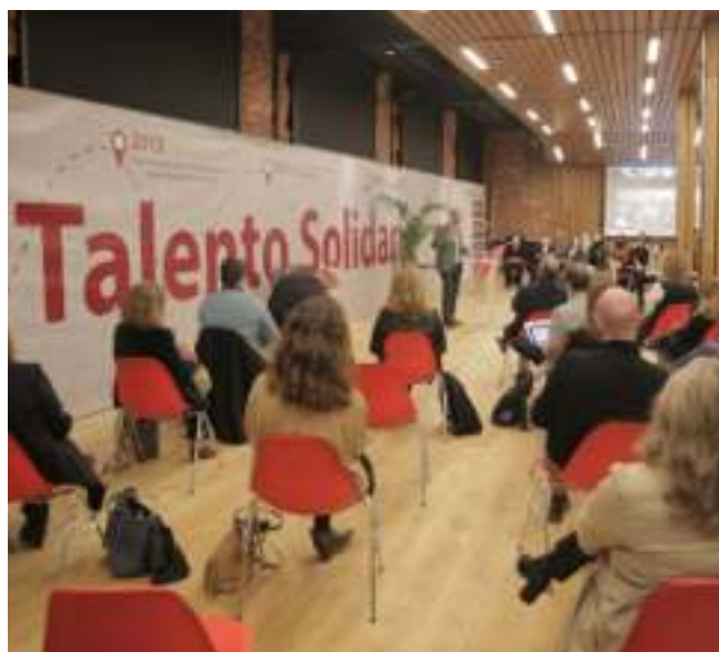
Acto de lanzamiento de la convocatoria de Talento Solidario