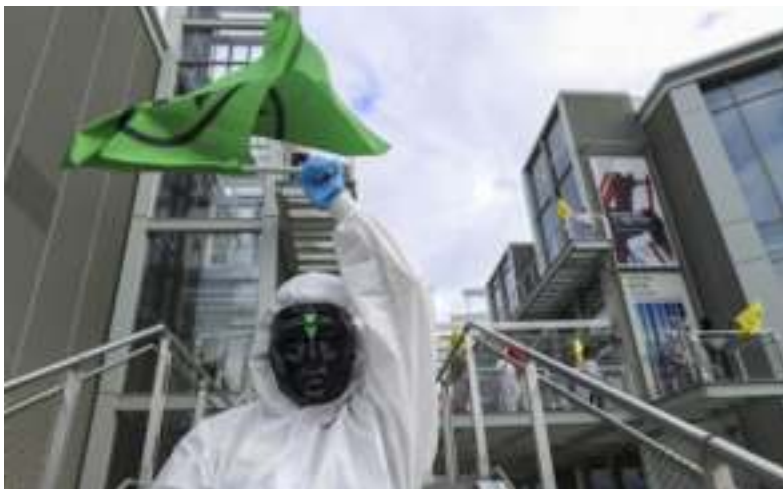
Espectáculo de teatro inmersivo "Sobreexposición"