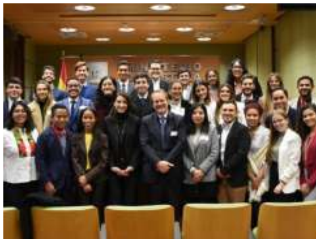
Visita al Ministerio de Justicia