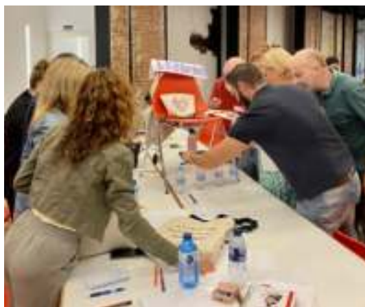
Formación inicial nuevos centros 2022/2023, Madrid