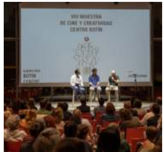
Coloquio de la VIII Muestra de Cine y Creatividad

para mirar despacio o De tú a tú . También hemos fomentado la lectura gracias a las recomendaciones de libros que las bibliotecas de Cantabria hacen tras una visita inspiradora a las exposiciones, habiéndose involucrado 13 bibliotecas con más de 150 libros recomendados.