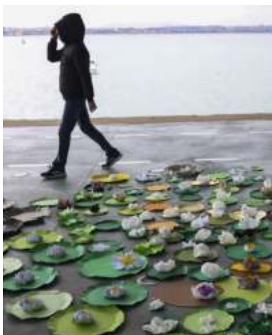
Actividad participativa en torno a la exposición "Thomas Demand: Mundo de papel"