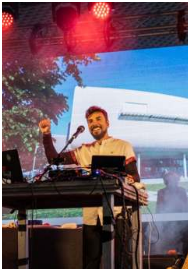
Concierto de Ain TheMachine, con motivo del quinto aniversario del Centro Botín