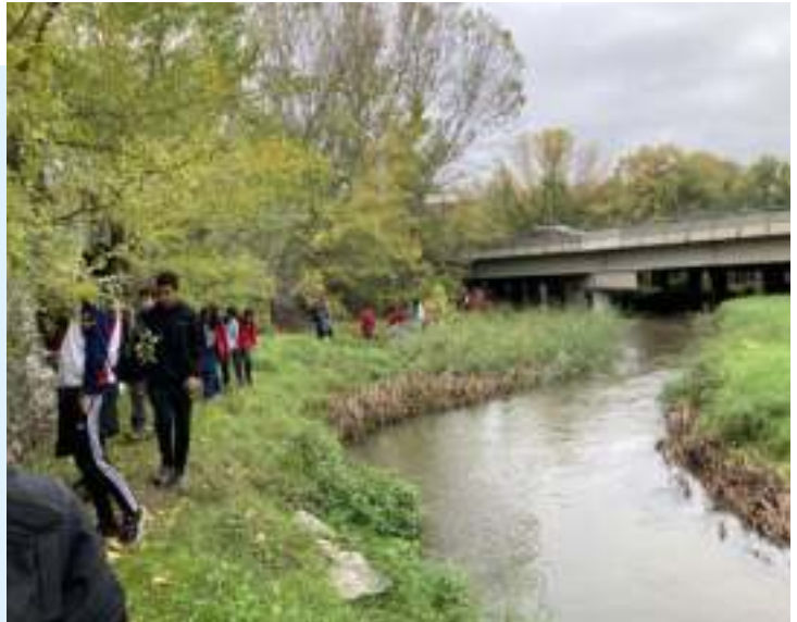
Caminata guiada -con charlas técnicas y performances artísticas- por las orillas del río Manzanares con los alumnos del Programa para el Fortalecimiento de la Función Pública en América Latina