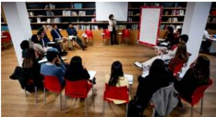
Más de 250 jóvenes han recibido servicios de mentoring individual o grupal por parte de la Fundación Princesa de Girona