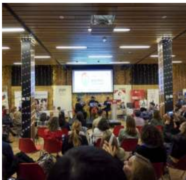
Punto de voluntariado de Navidad. Talento Solidario