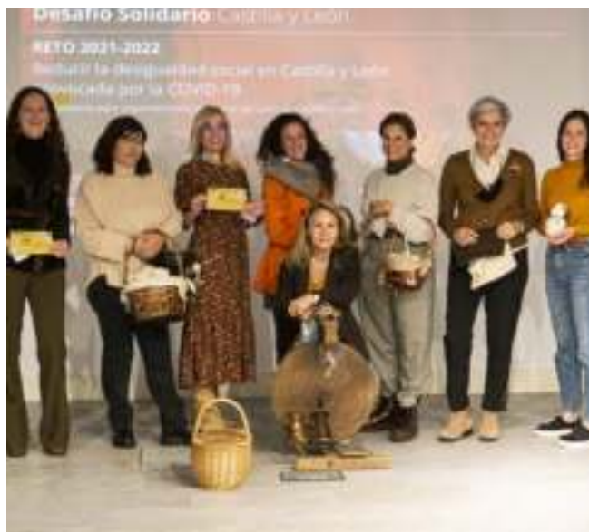
Proyecto Repobladores del Desafío de Talento Solidario