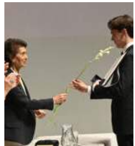
Entrega de premios del Concurso Internacional de Piano de Santander de la Fundación Isaac Albéniz. Agosto 2022