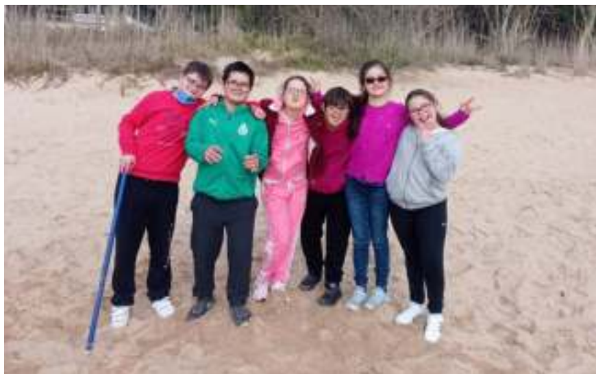
Actividad de la Fundación Síndrome de Down

Durante la XIII edición del programa, la Red siguió muy implicada y egresados de distintas ediciones, profesiones y países impartieron sesiones presenciales y online a los alumnos, poniendo así de manifiesto el valor del acompañamiento y la riqueza de una Red tan heterogénea como comprometida con los principios que la componen. Se realizaron ponencias sobre “Innovación en la Función Pública”; “Buen gobierno y transparencia”; “Sostenibilidad y educación”; “El rol de la tecnología en el ámbito público”; “Implementación de políticas públicas económicas en Brasil”; “El trabajo de la OEA en las Américas”; “Comunicación política” y “La situación actual de la región”. La última semana del programa se celebró la Jornada de Red en la Fundación Getulio Vargas, un encuentro de formación y trabajo entre los alumnos de la XIII edición con los representantes de las Redes Regionales y los Alumni