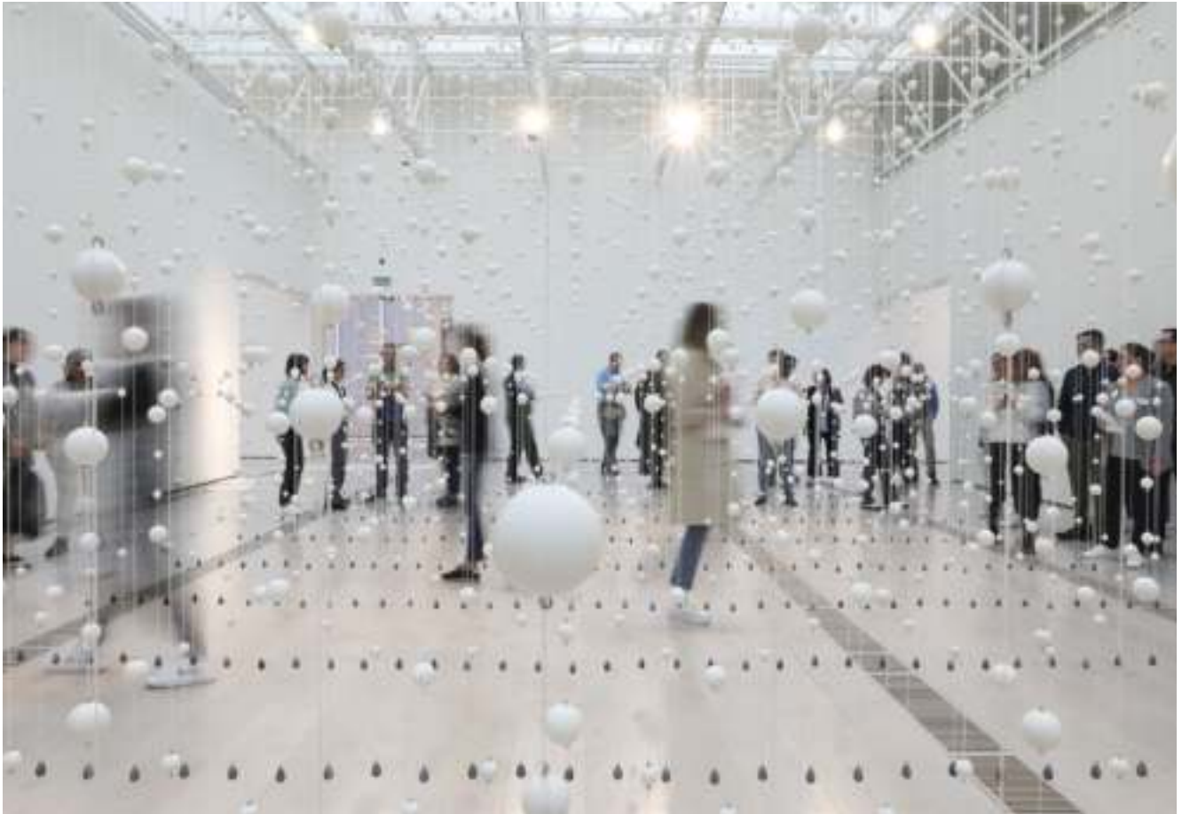
Vista de la exposición "Damián Ortega: Visión expandida"