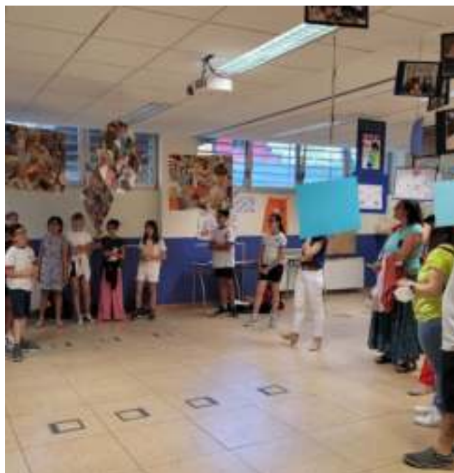
Exposición Educación Responsable en el Colegio El Porvenir (Madrid). Trabajos de los alumnos para la comunidad educativa