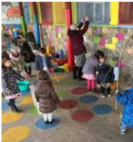
Programa de innovación interautonómico. OBSERVA ACCIÓN ER entre Castilla y León y Murcia