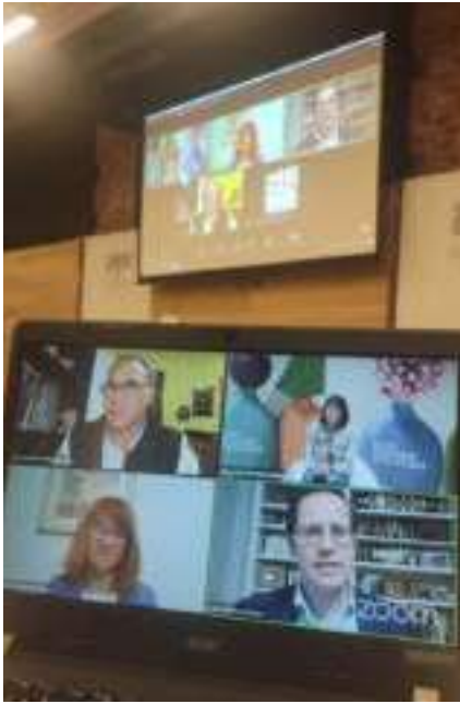
Conversa ER. Prevención del suicidio en la adolescencia