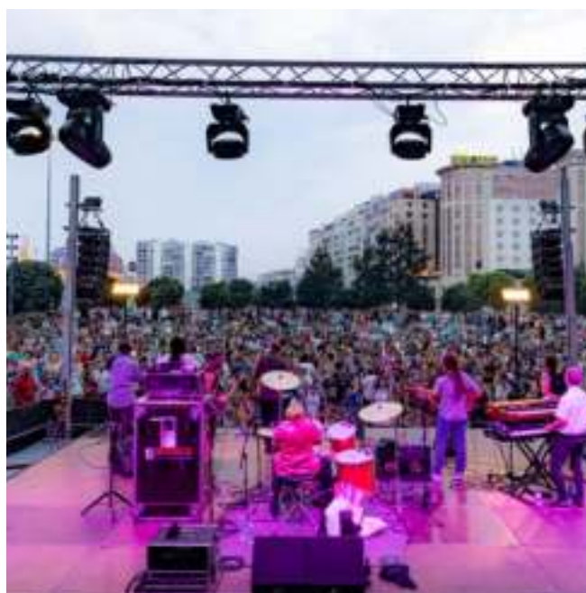
Concierto de The Skatalytes en el anfiteatro del Centro Botín