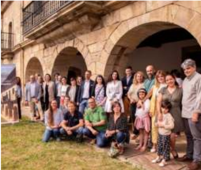
Emprendedores de la VII edición de Nansaemprende durante el acto de la clausura en la Casa Rectoral de Puente Pumar