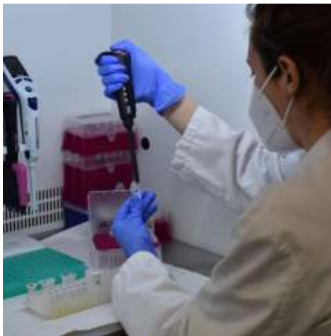
Laboratorio de la empresa EpiDisease