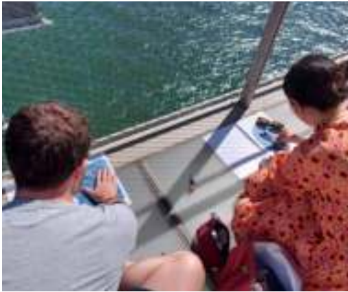
Acción creativa participativa "Camino de cianotipias"