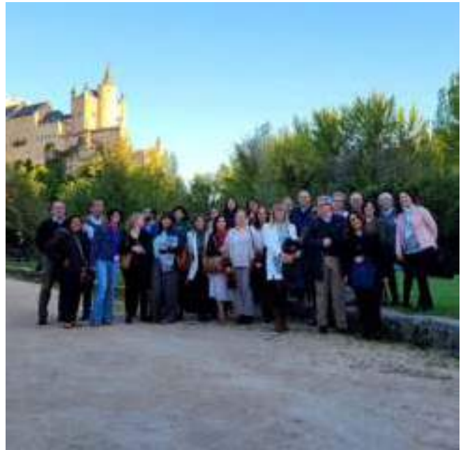
VII Encuentro Internacional de Coordinadores Generales ER. Segovia

Acompañar a los centros educativos que forman parte de la Red ha sido el gran reto de estos últimos años, marcados por la pandemia y las consecuencias de la misma. Este ha sido el primer año en el que todos los centros de la Red han vuelto a la normalidad; se han ido recuperando las formaciones presenciales y el acompañamiento en el propio centro. Además, se ha avanzado en el plan de innovación y actualización de los recursos educativos, especialmente el Banco de Herramientas , con el objetivo de poder trabajar, a través de la inteligencia emocional, social y la creatividad, las situaciones y desafíos en los que se encuentran los centros tan variados que conforman la RED ER.